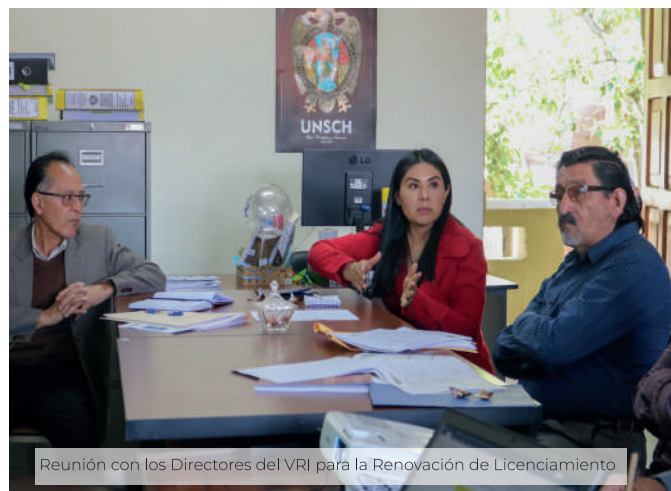
Reunión con los Directores del VRI para la Renovación de Licenciamiento