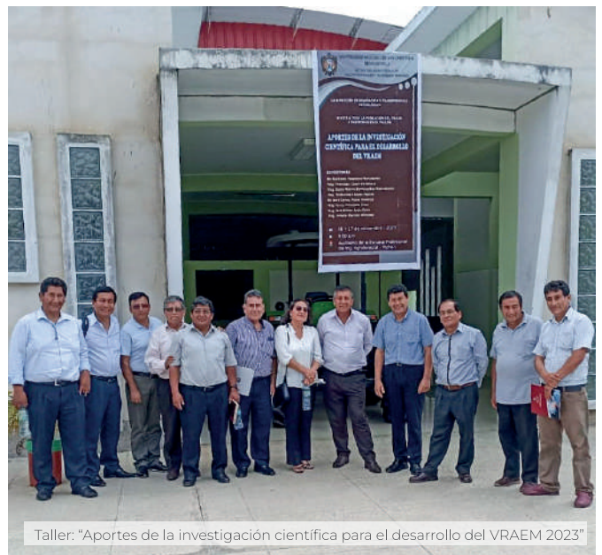
Taller: "Aportes de la investigación científica para el desarrollo del VRAEM 2023"