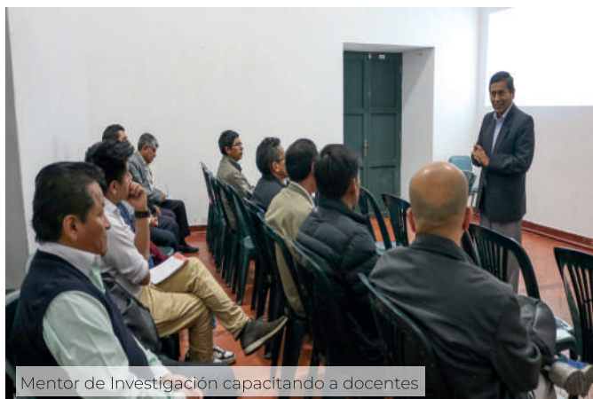
Mentor de Investigación capacitando a docentes