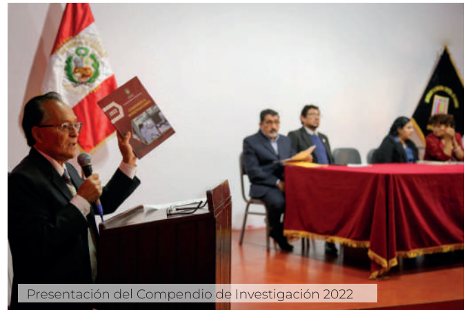
Presentación del Compendio de Investigación 2022