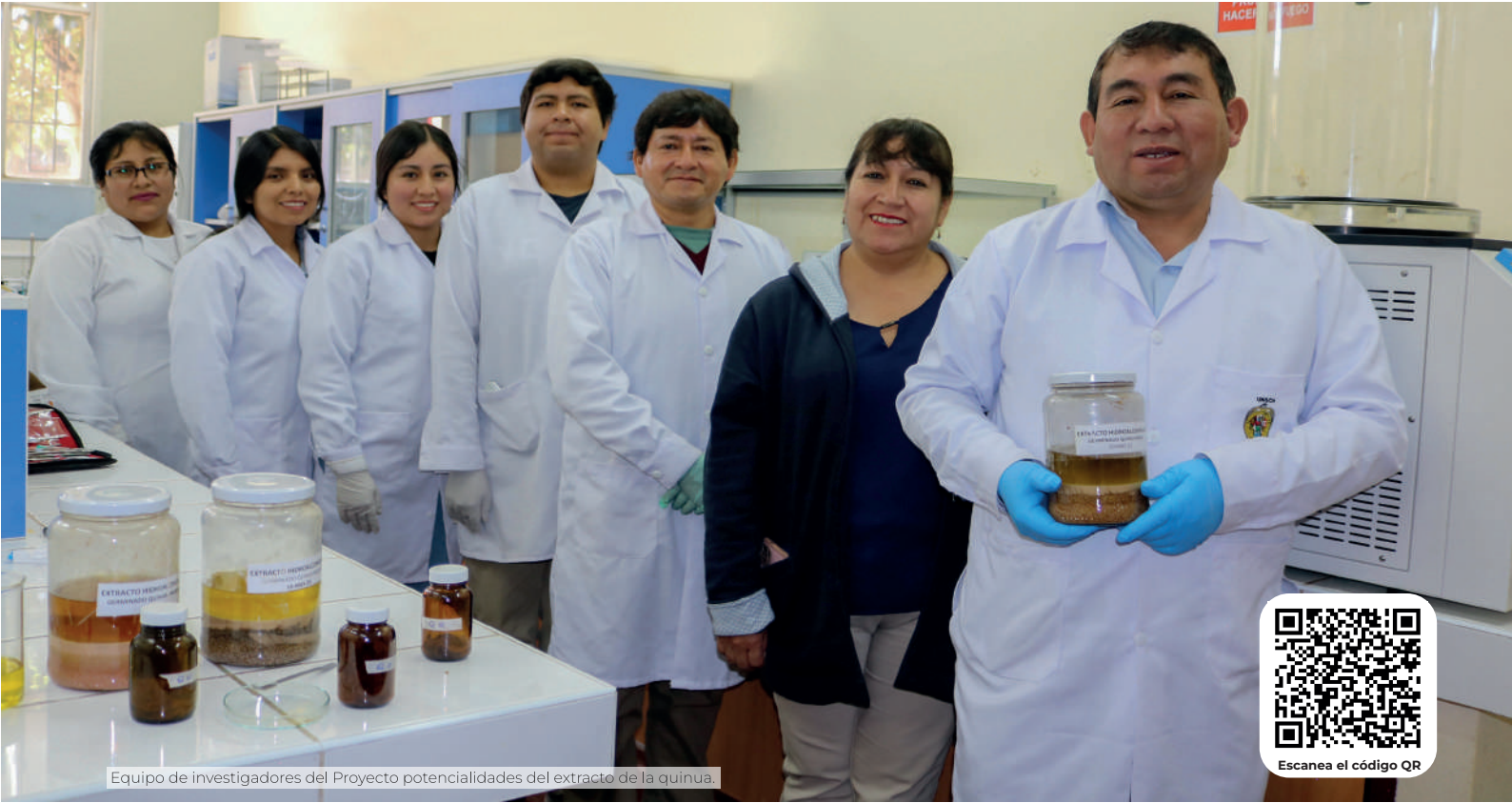
Equipo de investigadores del Proyecto potencialidades del extracto de la quinua.