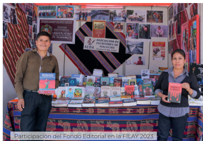
Participación del Fondo Editorial en la FILAY 2023