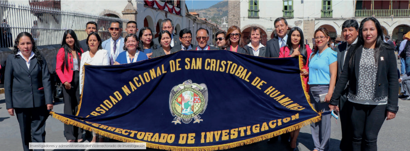
Investigadores y administrativos del Vicerrectorado de Investigación