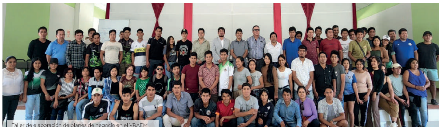
Taller de elaboración de planes de negocio en el VRAEM

Por otro lado, la dirección tramitó la firma de la Declaración de Asociación entre la “UNSCH” y “PUM Netherlands senior experts” de Países Bajos, dicho convenio tiene la finalidad de capacitar a estudiantes y docentes mentores de la UNSCH en temas de emprendimiento e innovación por parte de profesionales internacionales.