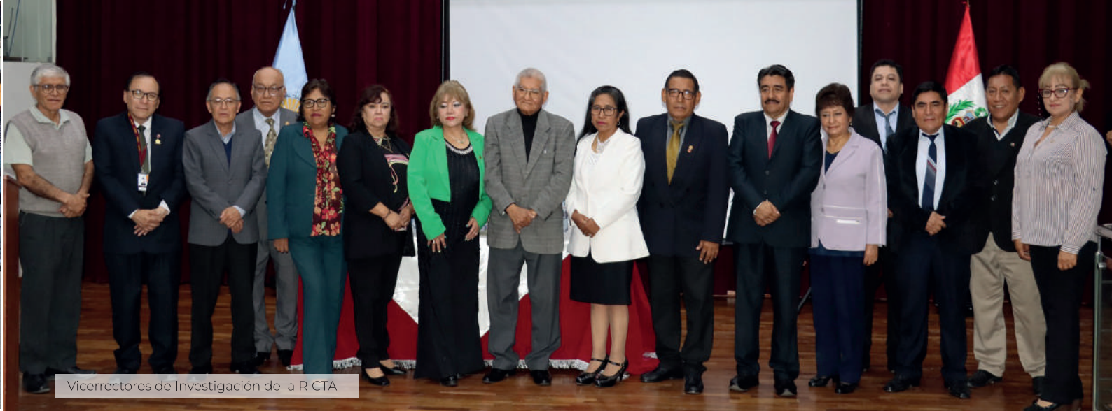
Vicerrectores de Investigación de la RICTA